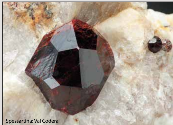
Spessartina: Val Codera