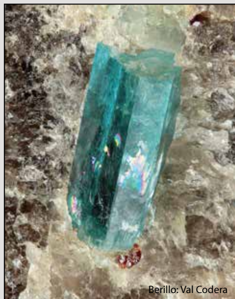
Berillo: Val Codera

Continue the exhibition dedicated to the minerals of the Italian Alps; in this edition concludes the Lombardy that, given to the great mineral wealth, in the last year had been represented just in part with Valmalenco, high province of Sondrio and Valcamonica (with the excellent and recent samples of epidote). In 2016, the review will consider the remaining province of Sondrio, with Val Masino, Chiavennasco and Val Codera (famous the beautiful aquamarines and garnets of its pegmatites) in addition to the provinces of Lecco, Varese (Cuasso al Monte), Bergamo (lead and zinc mines of the Brembana Valley, the beautiful fluorites from Zogno) and Brescia, where will be completed the anticipation given in 2015 about Val Camonica with the classic localities around Adamello (tourmalines from Valle Adamè, Braone, etc ..). This just to mention the most significant localities. Lombardy boasts many researchers and collectors, very active in the area; thanks to their passionate work, this region has been enriched by mineralogical point of view with many finds, some of which are very recent. This and more at EUROMINERALEXPO 2016 : a selection of extraordinary specimens from Museums and private collections that show the best of what Alps and pre-Alps of Lombardy have given.